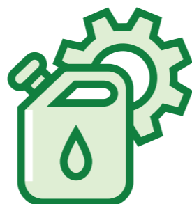
TABLEAU DES USAGES AUTORISÉS

Les mélanges doivent être mis en œuvre conformément à la réglementation en vigueur selon l'arrêté du 7 avril 2010 modifié par l'arrêté du 12 juin 2015. En cas d'utilisation en mélange, contactez un représentant de HELM AG ou votre distributeur pour valider la possibilité d'associations.