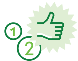
Facile à utiliser