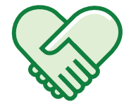
Respect de l'homme